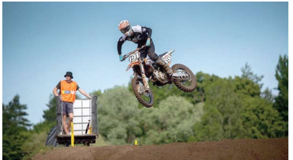
Sportininkų šuolius buvo galima stebėti nuo 14-os tramplinų.