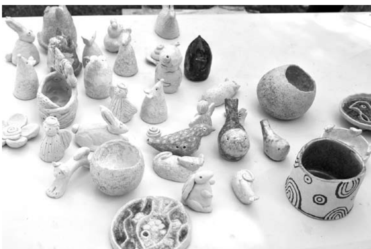
O taip atrodo jau išdegti, išdekoruoti keraminiai darbai, atvežti parodai į Kunigiškius iš Panevėžio.

„Spalvoto molio paukštės“ plenero dalyvių darbai liks „Atvertų langinių“ pažinimo centre. Čia per ketverius metus jau sukaupti šimtai vaikų kūrybinių darbų. Vien parodų įvairiose erdvėse organizuota per tris dešimtis. Visuomenė turės progą parodose išsvysti ir šiųmetinio plenero kūrinius.