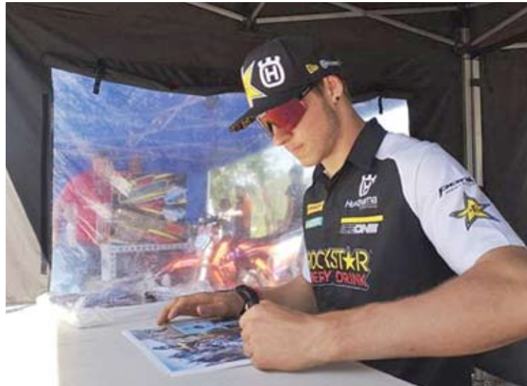
Pasaulio čempionato dalyvio Armino Jasikonio autografai gerbėjams.