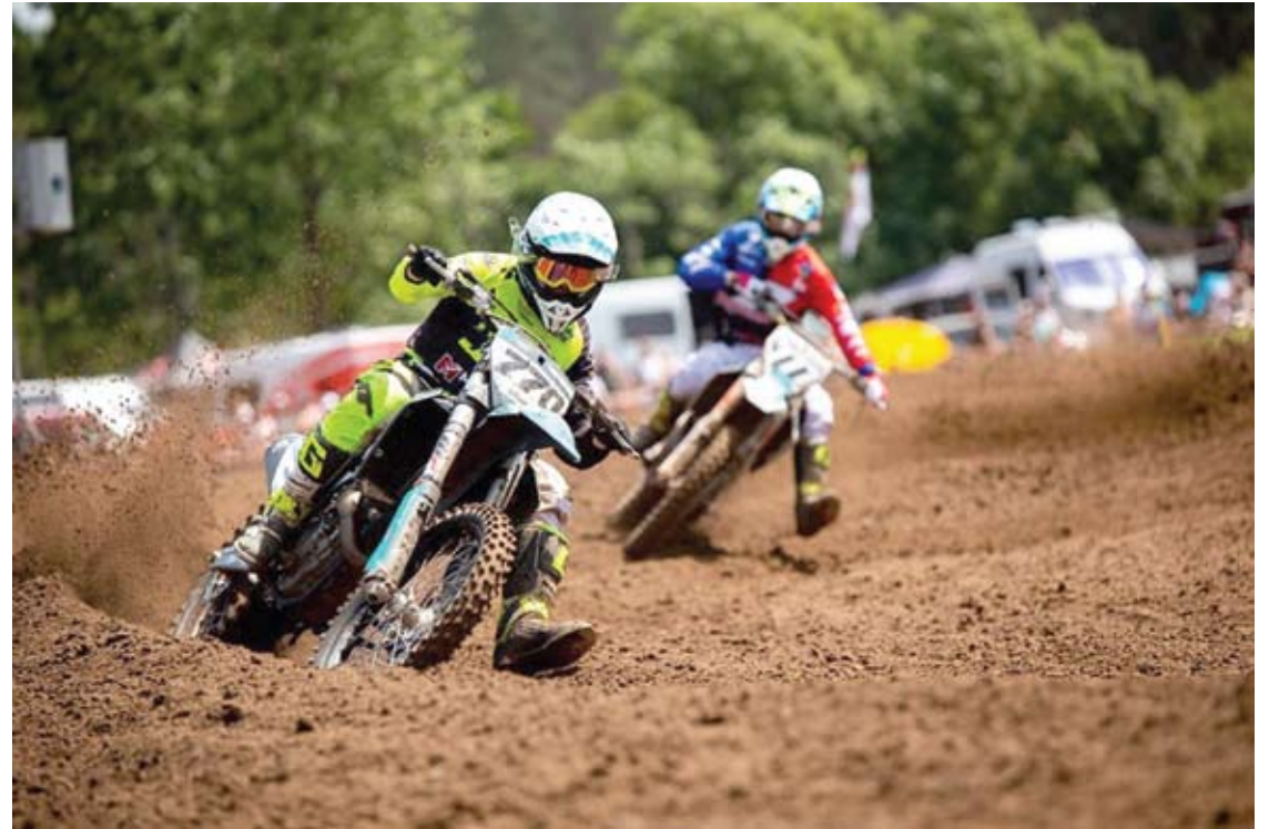
Savaitgalį sportininkams teko kęsti nepakeliamą karštį - termometrai rodė per 30 laipsnių.