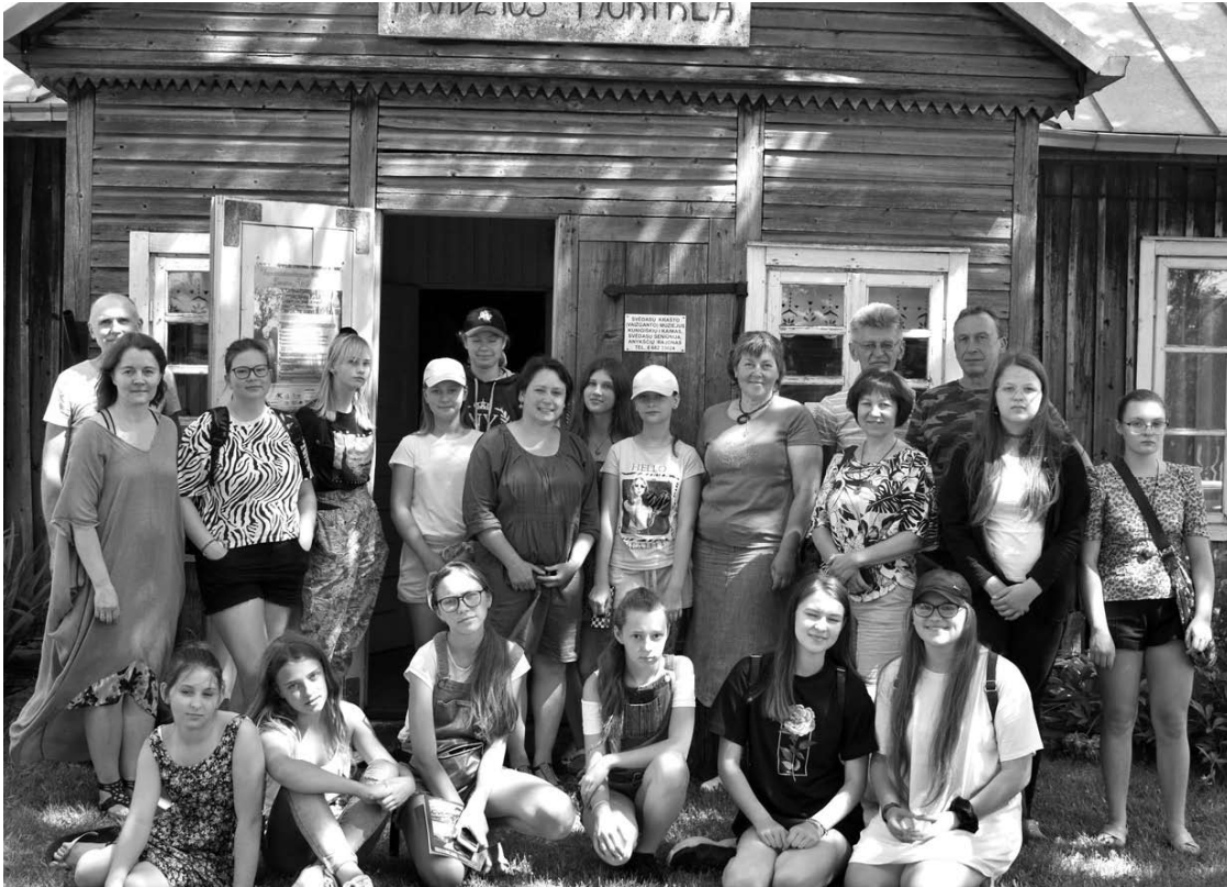
Prisiminimui šalia Svėdasų krašto (Vaižganto) muziejaus nusifotografavo visi kūrybinės stovyklos-plenero organizatoriai ir dalyviai.

Šeštadienį, birželio 27-ąją, buvo organizuotos jungtinės meno dirbtuvės, kuriose dalyvavo stovyklavę moksleiviai, taip pat ir būrelis Rokiškio, Utenos, Anykščių ir Kupiškio meno mokyklų auklėtinių bei pedagogų.