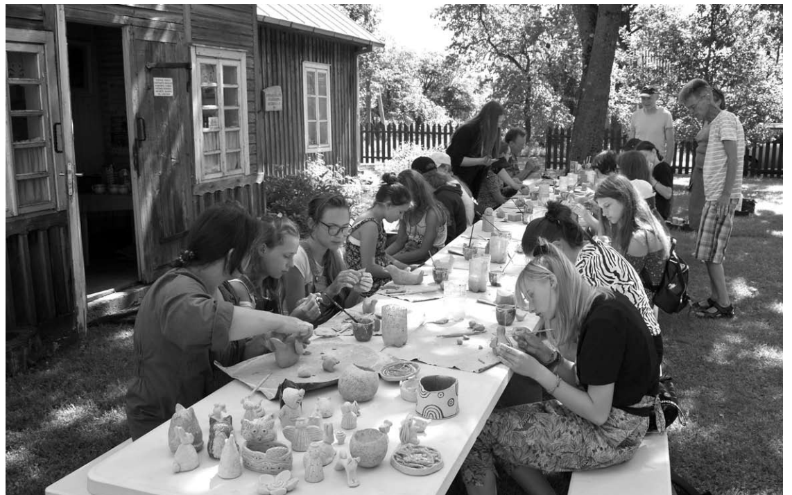
Moksleiviai ir jų pedagogai prie stalų muziejaus kiemelyje pasinėrė į kūrybinį procesą.